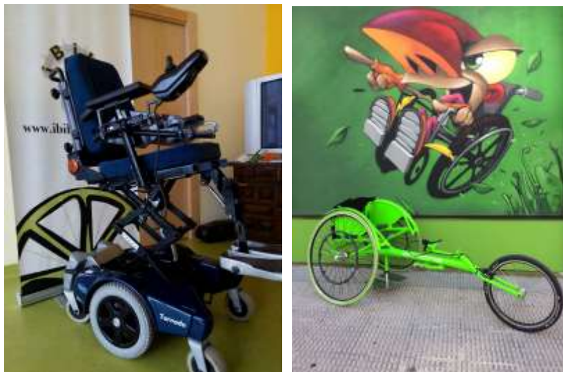
*Fotografía de dos de los materiales bajo custodia para el alquiler

un stock para que las personas que lo deseen por un 1€ la hora puedan poder usar ese material sin la necesidad de una compra.