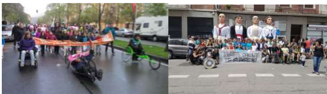
*Fotografías de dos actividades desarrolladas en el barrio donde participamos como entidad.

Ibili en la actualidad es una de las entidades que está presente en diferentes grupos de trabajo a nivel comunitario de la Rotxapea, tanto que en la coordinadora de barrio Ibili junto con la Federación Batean son voces legitimadas para representar al barrio.