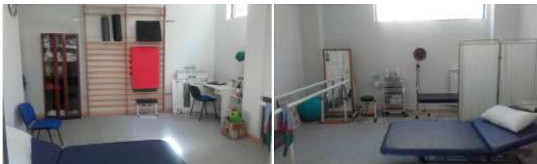
*fotografías del espacio destinado para el desarrollo de la fisioterapia.

La intervención fisioterapéutica se desarrolla de manera individual con una duración de 1 hora, en un espacio habilitado y específico para tal fin.